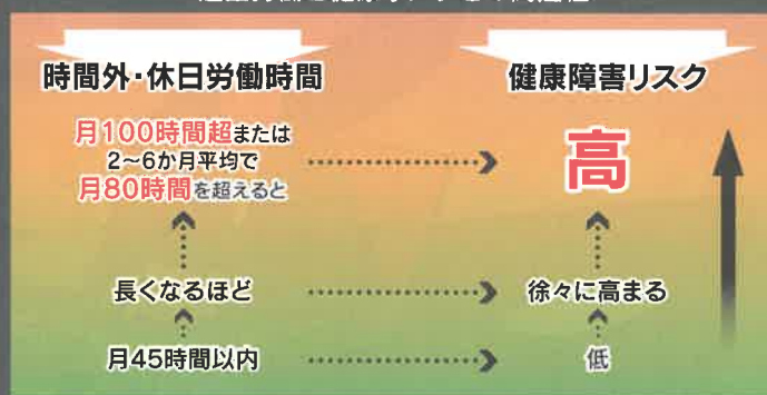
過重労働と健康リスクとの関連性

(右の図は、労災補償に係る脳・心臓疾患の労災認定基準の考え方の基礎となった医学的検討結果を踏まえたものです。)